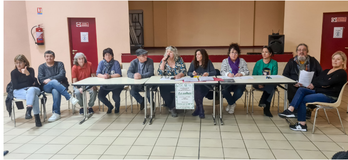
Le conseil d'administration élu lors de l'AG

L'assemblée générale constitutive de l'épicerie participative "Le cabas de Saint Jean de Valérisclé" a eu lieu le mardi 17 février au Trianon.