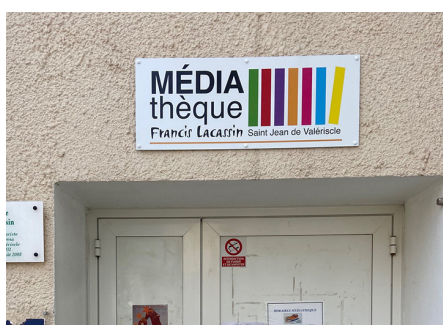
Un panneau pour signaler la médiathèque

Les déjections canines ou félines deviennent un véritable fléau. Afin d'encourager les propriétaires, 3 stations canines ont été implantées dans le village. Des sacs plastiques sont à disposition ainsi que des poubelles. Merci de bien vouloir faire l'effort de ramasser les crottes et de ne pas laisser les animaux divaguer dans les rues.