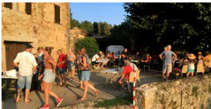
Soirées crêpes dans les quartiers durant tout l'été par l'Auberge de la Tour.