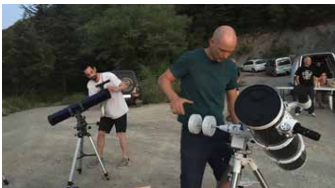
La Nuit des étoiles, un beau succès pour une première.