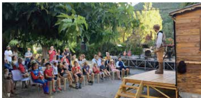
Animations médiévales dans le quartier de la Tournelle mais aussi sur le Square Fernand Gineste qui ont rappelé des souvenirs aux anciens.

Les festivités d'été ont été organisées par l'Association familiale, la Boulange, le Sou des écoles "Tous ensemble", le Musée des Blasons, la Municipalité de Saint Jean de Valérisclé et l'Auberge de la tour.