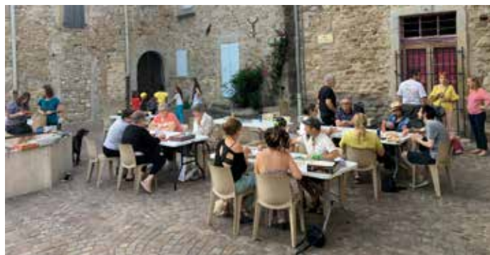
Soirées jeux place de l'église.