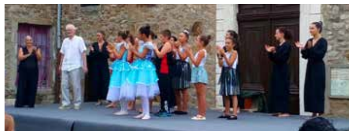
Spectacle de danse.