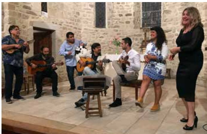
Juin : concert du Festival Guitare en Cévennes dans l'église.