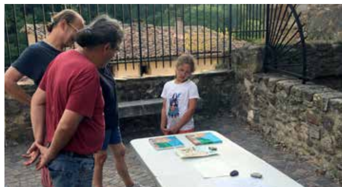
Concours de dessins pour les enfants.