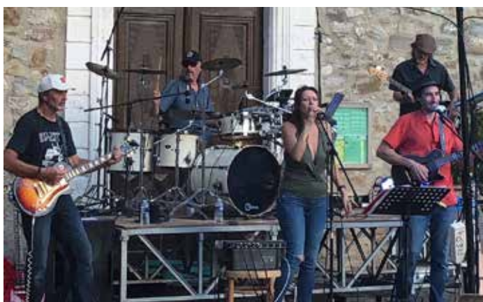
Juin : même décor mais cette fois c'est rock' roll