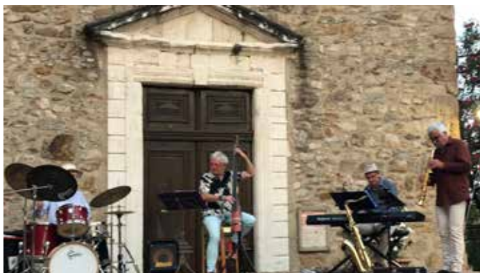
Juillet : concert de jazz devant l'église.